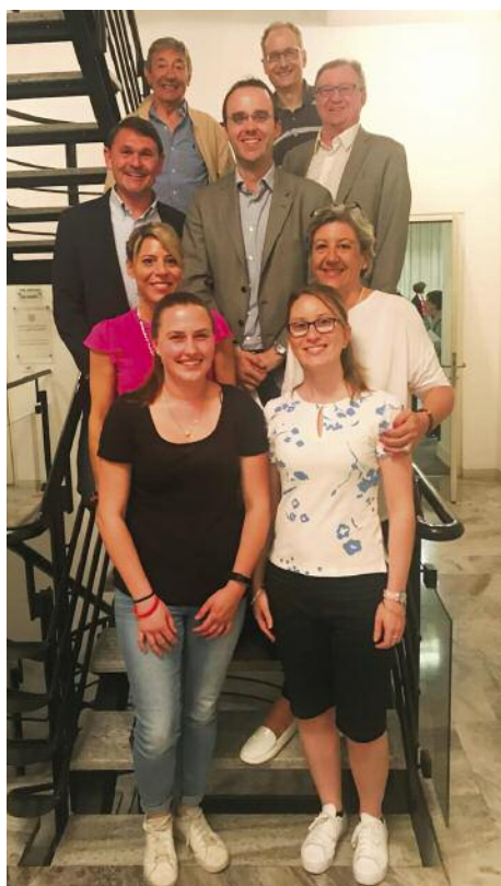
Comitato Filarmonica di Castagnola 2018.